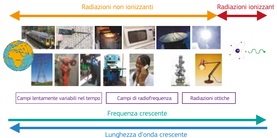
Figura 3.1 — Rappresentazione schematica dello spettro elettromagnetico in cui figurano alcune tipiche sorgenti

La presente guida intende fornire ai datori di lavoro informazioni sulle sorgenti di campi elettromagnetici situate nell'ambiente di lavoro, per aiutarli a decidere se sia necessaria un'ulteriore valutazione dei rischi derivanti dai campi elettromagnetici. Le dimensioni e l'intensità dei campi elettromagnetici prodotti dipende dalla tensione, dalle correnti e dalle frequenze con cui l'apparecchiatura funziona o che essa genera, nonché dalla sua progettazione. Alcune apparecchiature sono progettate in modo da generare intenzionalmente campi elettromagnetici esterni. In tal caso, piccole apparecchiature a bassa potenza possono produrre notevoli campi elettromagnetici esterni. Generalmente le apparecchiature che utilizzano correnti o tensioni elevate o che sono progettate per emettere radiazioni elettromagnetiche richiedono un'ulteriore valutazione.